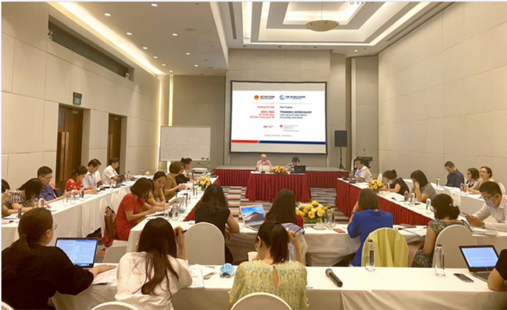
Khóa đào tạo chuẩn mực kế toán công quốc tế do Bộ Tài chính và Ngân hàng Thế giới tổ chức tại Hà Nội.